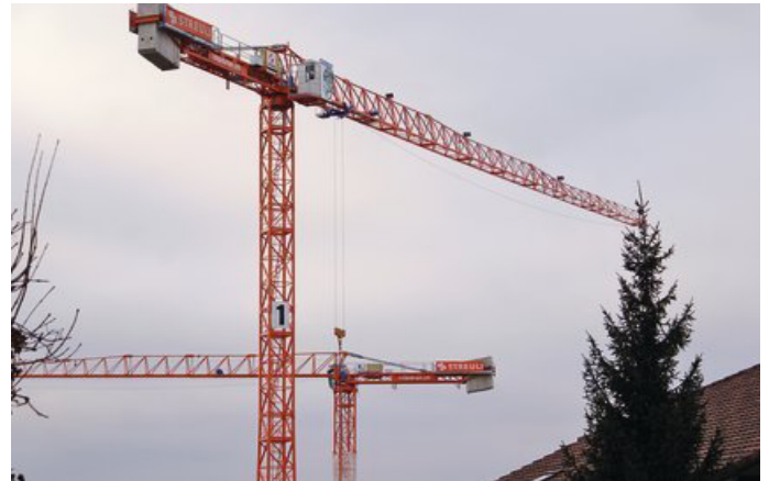
Die beiden von Interkran in Rekordzeit gestellten Obendreher – statt in Raimondi-Blau in Streuli-Orangerot.

Mehr Informationen: Interkran AG Antonio Teixeira 8832 Wollerau SZ www.interkran.ch